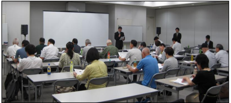
■JR 宇都宮駅西口地区定例総会の議案の審議風景

この議案が承認されたことにより、同一地権者から複数の会費を徴収するという問題が解決され、加入されていない地権者のまちづくり協議会への参加も期待されます。最後に④平成 25 年度事業計画(案)、⑤平成 25 年度収支予算(案)が賛成多数で承認され、 全議案が、原案通り承認されました。