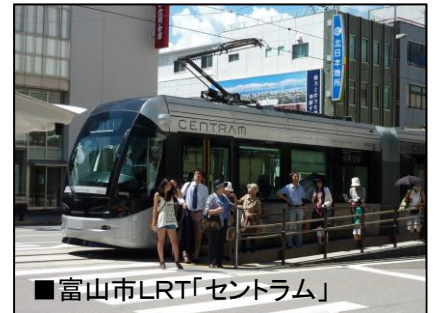
■富山市LRT「セントラム」