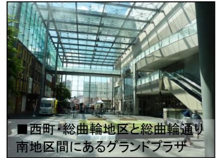
■西町・総曲輪地区と総曲輪通り南地区間にあるグランドプラザ

JR 富山駅は、金沢と同じく北陸新幹線の工事がおこなわれており、東西地下通路(自転車も押し可)の整備、駅を挟んで2系統あるLRT路線の結合、東西両駅前のバスロータリーの整備など金沢と同じように公共交通を重視した駅前の整備をしていました。