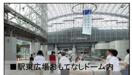
■駅東広場おもてなしドーム内