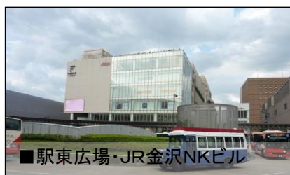
■駅東広場・JR金沢NKビル