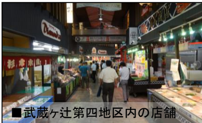
■武蔵ヶ辻第四地区内の店舗