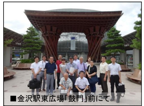
■金沢駅東広場「鼓門」前にて

金沢市は人口約 46 万人、富山市は約 42 万人と宇都宮市の人口(約 52 万人)と、同規模の地方中核都市です。そして両市とも北陸新幹線開業を控え JR の駅前を中心に整備を進めているところです。また、商業の中心地域が JR の駅前から離れていることや、中心市街地の空洞化が進んでいることなど宇都宮市と共通する問題をかかえている地方都市といえます。特に富山市では公共交通として LRT を導入しており、これから L R T の導入を検討している宇都宮市民の立場としても有意義な視察となりました。