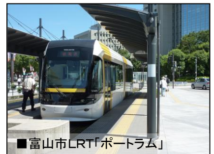
■富山市LRT「ポートラム」