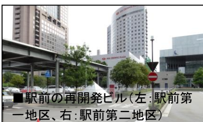
■駅前の再開発ビル(左:駅前第一地区、右:駅前第二地区)

平成 27 年の北陸新幹線開業をめざし、観光都市金沢の景観と公共交通を重視した街づくりをしていると感じました。